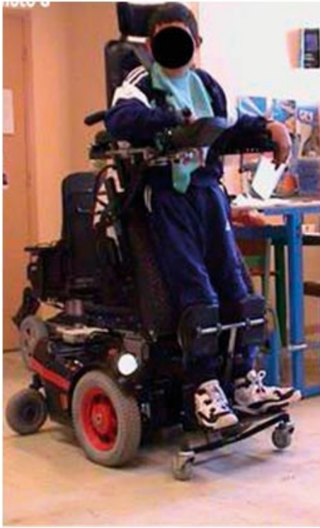
Figure 3 Fauteuil verticalisateur permettant de maintenir la personne en situation verticale. http://www.clinique-du-dos.com/travaux/handicap- moteur.php